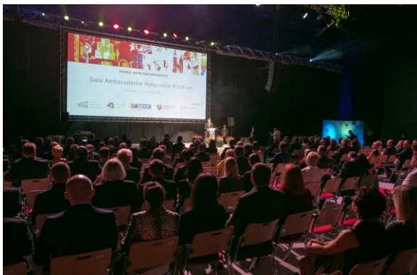
Gala AKP 2015 (obiekt: MCK w Katowicach)